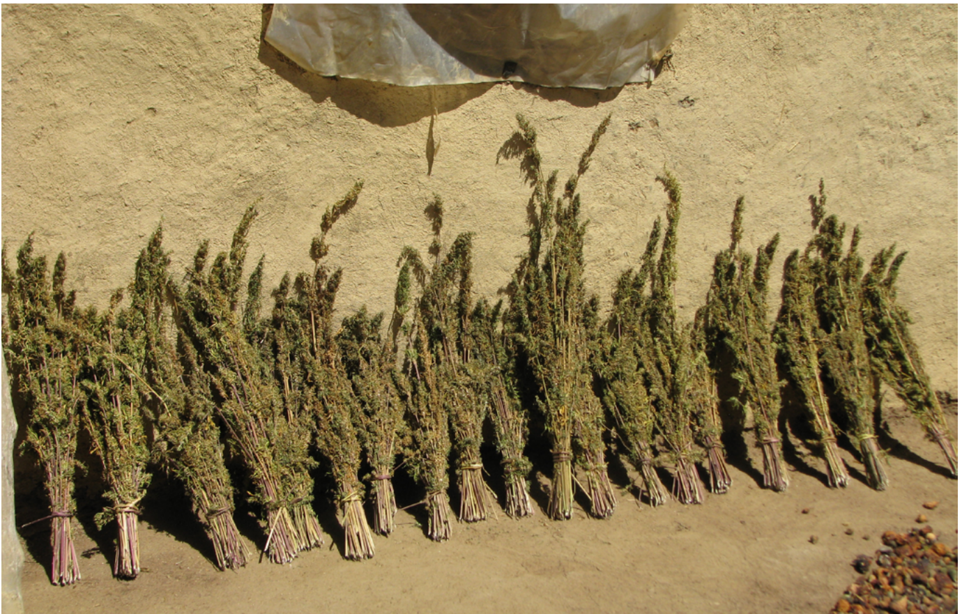
Cannabis secándose en Marruecos.

Además, lo que ahora podemos ver es que no se dará el caso de que los Estados enfrenten una condena significativa de la comunidad internacional por unas reformas de cannabis que son una práctica cada vez más habitual en todo el mundo. Optar por la reforma y admitir el incumplimiento de los tratados puede ayudar a sentar las bases para unas opciones de reforma que se puedan aplicar colectivamente entre Estados afines, como la opción inter se .