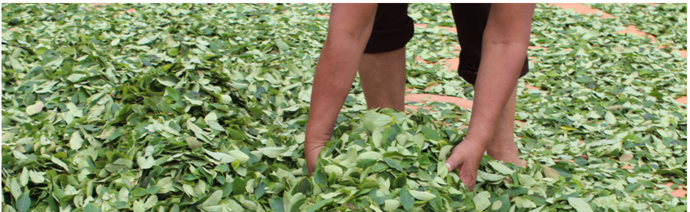
Hojas de coca secándose en Bolivia.

En el caso del cannabis, sin embargo, este proceso se ve aún más complicado por el hecho de que (junto con la coca y el opio) también es mencionado de forma explícita en artículos concretos de las convenciones de 1961 y 1988. Por lo tanto, puede que reclasificar el cannabis o retirarlo de las listas no baste para permitir unos mercados totalmente regulados en la línea de los cambios que se están poniendo en marcha en varias jurisdicciones actualmente. Lo más probable es que también se necesitara algún tipo de enmienda, modificación o reserva a esos tratados.