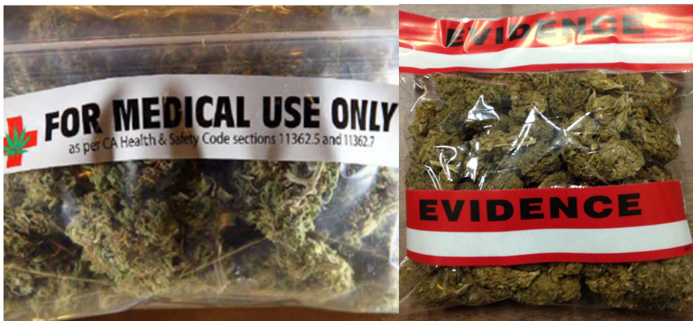
La planta de cannabis como producto médico lícito y como prueba policial.

tratados de 1969: “El acuerdo en virtud del cual se enmienda el tratado no obligará a ningún Estado que sea ya parte en el tratado pero no llegue a serlo en ese acuerdo”. 30 Por lo tanto, los Estados que no deseen contraer obligaciones con el tratado en su forma enmendada podrán mantener las obligaciones anteriores. 31