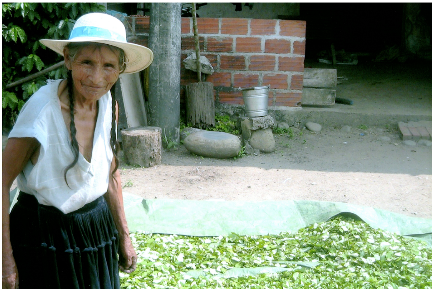
Una mujer seca hoja de coca en Apolo, Bolivia.

Cualquier intento de promover el diálogo de alto nivel, explorar posibles reformas internas o lograr reformas del marco multilateral se verá facilitado por la acción colectiva de los Estados afines que trabajan por una causa común. Aprovechando la diversidad de los distintos países, una alianza de Estados con