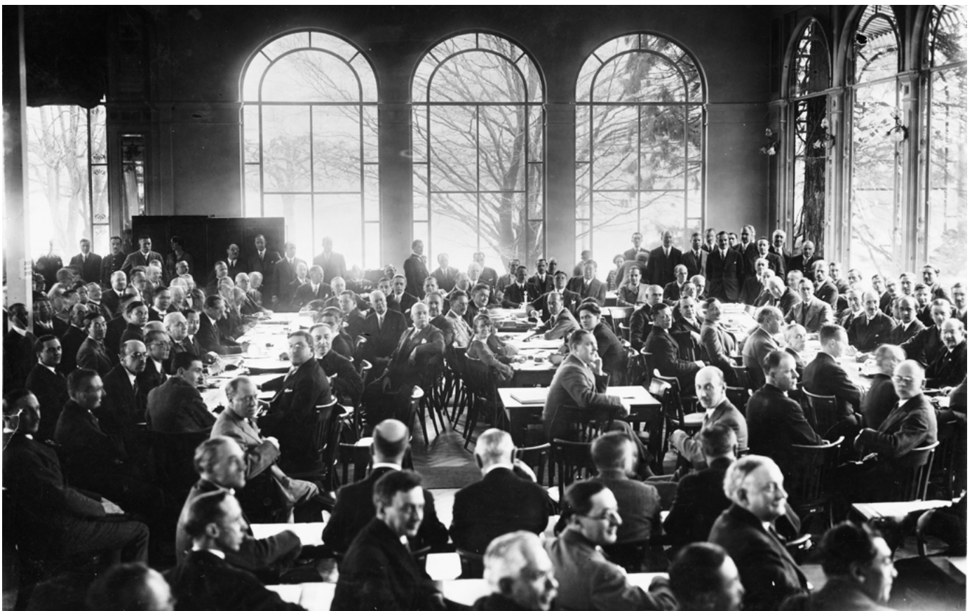
Segunda Conferencia del Opio en Ginebra, 1924-1925.

Auge y caída de la prohibición del cannabis. La historia del cannabis en el sistema de control de drogas de la ONU y opciones de reforma (Transnational Institute y Global Drug Policy Observatory, marzo de 2014), https://www.tni.org/es/publicacion/auge-y-caida-de-la-prohibicion-del-cannabis